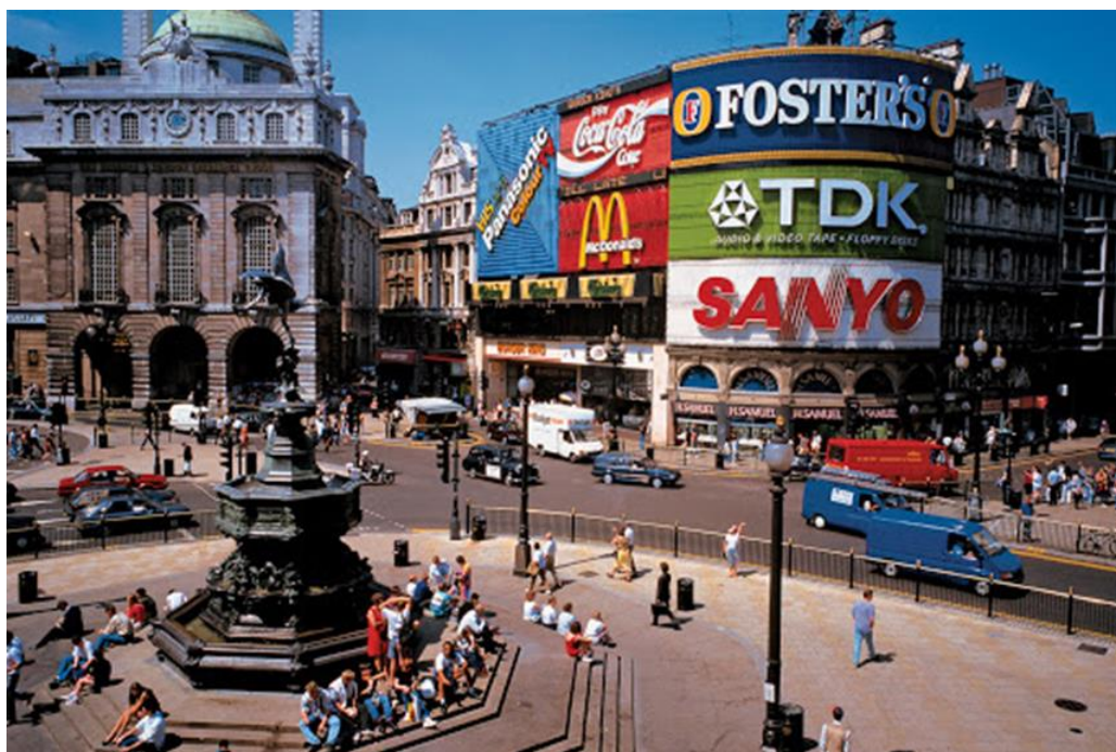
Лондондаги Пиккадилли майдони.

Бошқа худудлар майдони (ландшафт, акватория..)