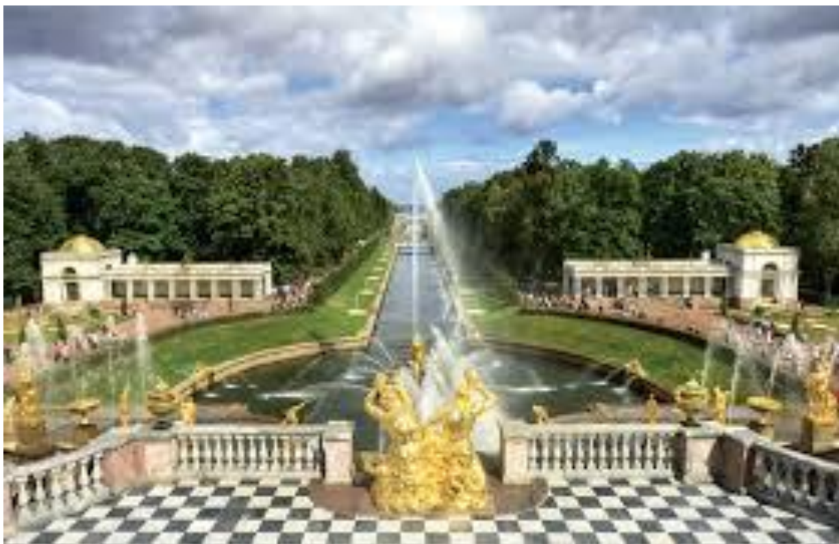
Композицион ўққа мисол.

Композицион ўқлар —шартли чизиқлар бўлиб, ҳажмларнинг фазо билан ўзаро таъсирини ва уйғунлигини белгилайди. Улар фазовий (магистраль кўчаларда) ва ҳажмий (доминант ва акцент иншоот ва элементларнинг оғирлик марказларини боғловчи бўлиб, ансамблдаги асосий эстетик “жозибадор” нуктага диққатни йўналтиради).