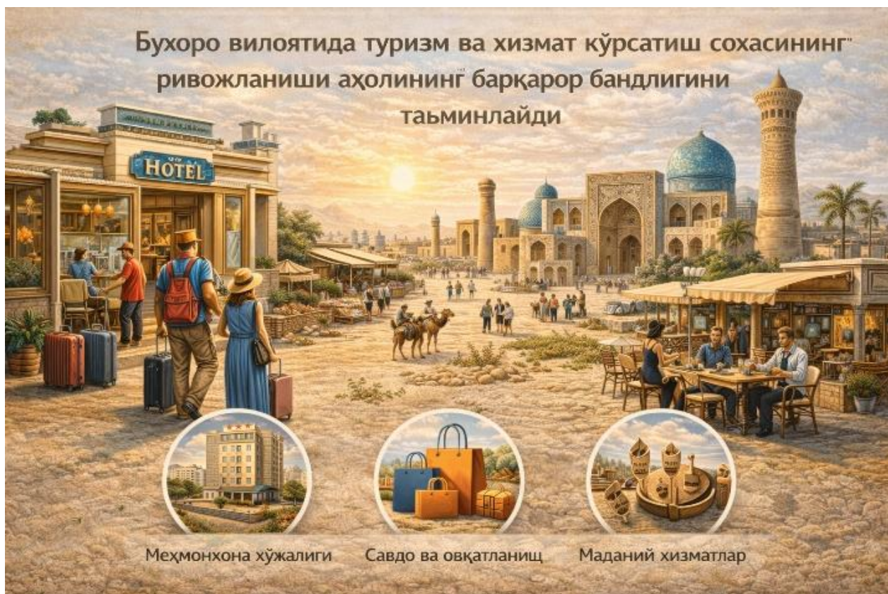
6-расм. Бухоро вилоятида аҳоли бандлиги

Шу тариқа, Жиззах ва Бухоро вилоятларида демографик жараёнлар ва бандлик хусусиятларининг фарқлиги шаҳар ҳудудларининг кенгайиш суръатлари, турар жойлар жойлашуви ва шаҳарсозлик ечимларининг турлича шаклланишига олиб келмоқда. Ушбу омилларни ҳисобга олган ҳолда шаҳарларни режалаштириш аҳоли эҳтиёжларига мос, ижтимоий барқарор ва иқтисодий самарали бўлиши зарур.