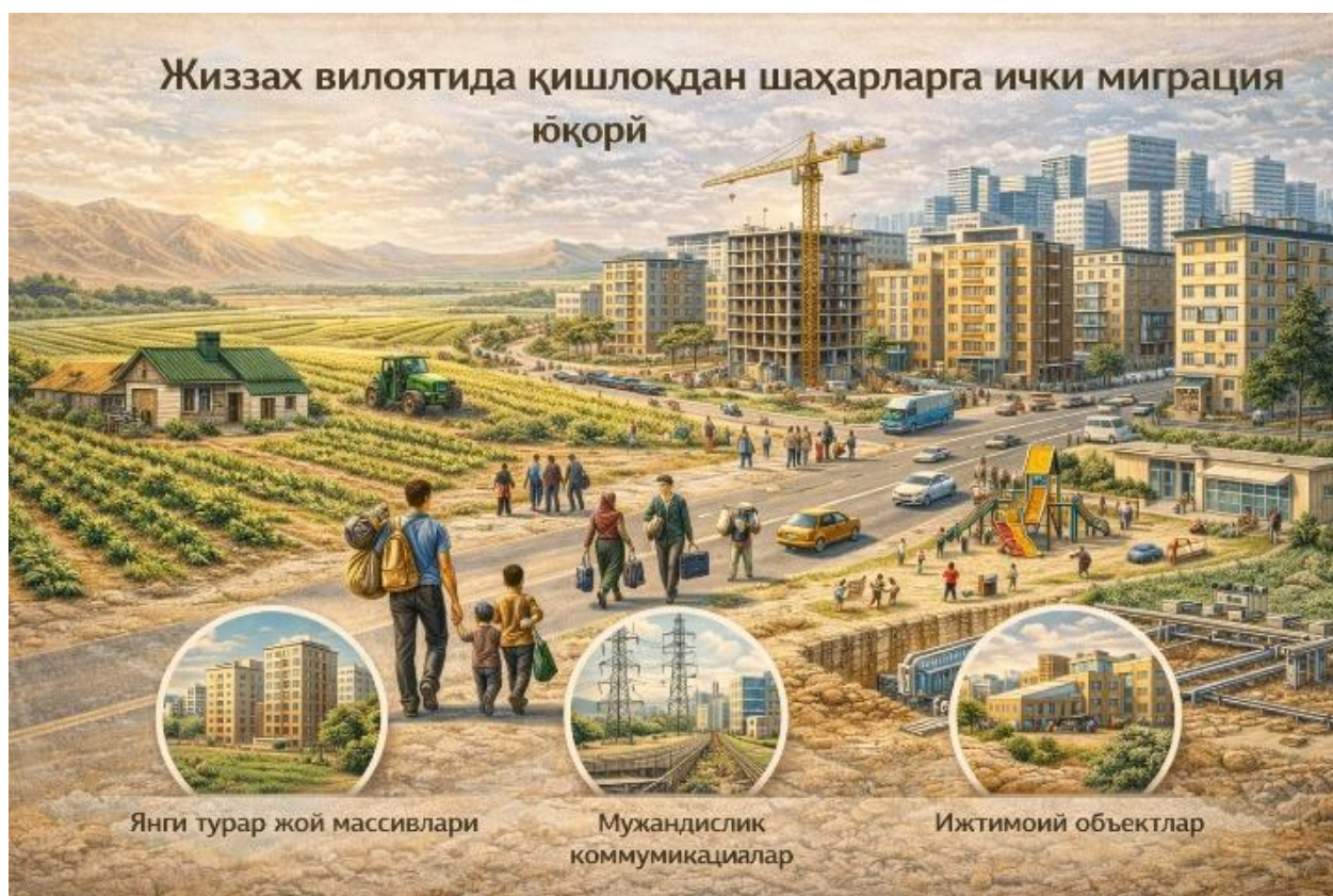
5-расм. Жиззах вилояти ички миграцияси

коммуникациялари, транспорт тармоқлари ҳамда ижтимоий объектларга бўлган талаб ортиб бормоқда (5-расм).