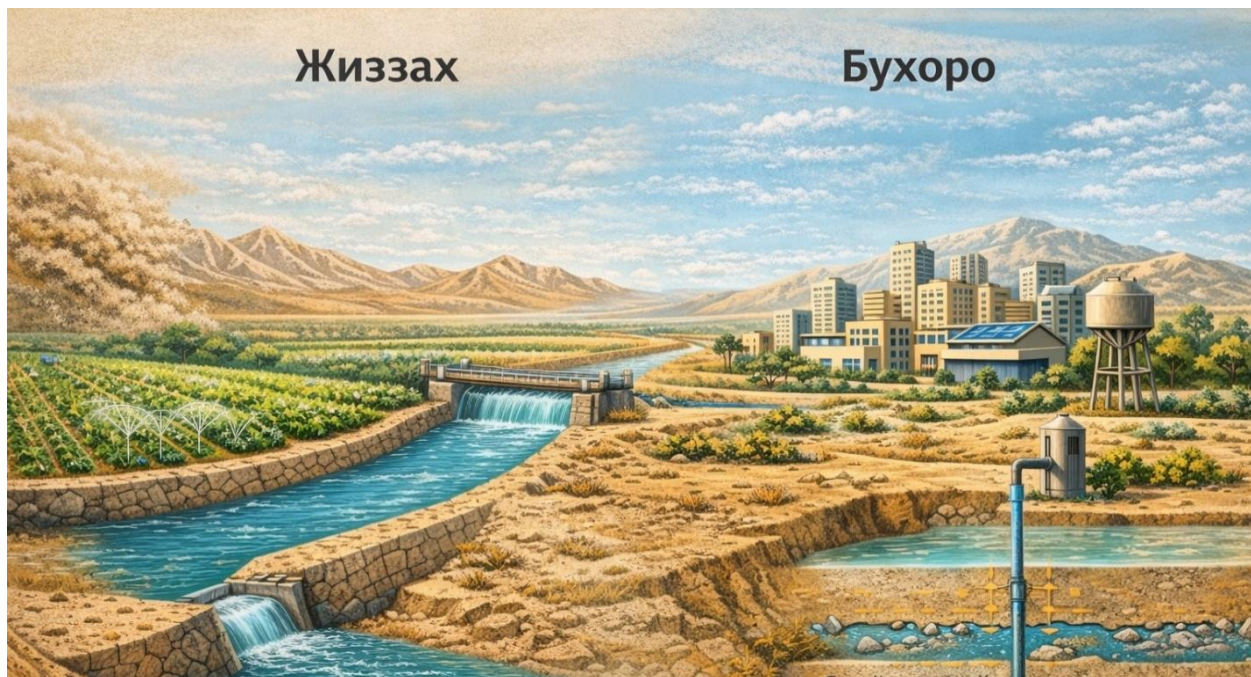
3-расм. Жиззах ва Бухоро вилоятининг сув тизимлари

қишлоқ хўжалиги натижасида ер ости сув захираларига бўлган босим йилдан-йилга ортиб бормоқда. Бу ҳолат сув сатҳининг пасайиши, минераллашув даражасининг ошиши ва айрим ҳудудларда сув сифати ёмонлашувиغا олиб келмоқда (3-расм).